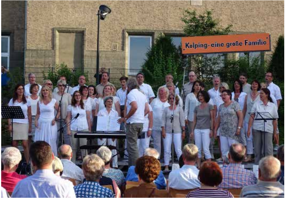
Der Chor „pianoforte“ begeisterte die Gäste beim Sommerabend