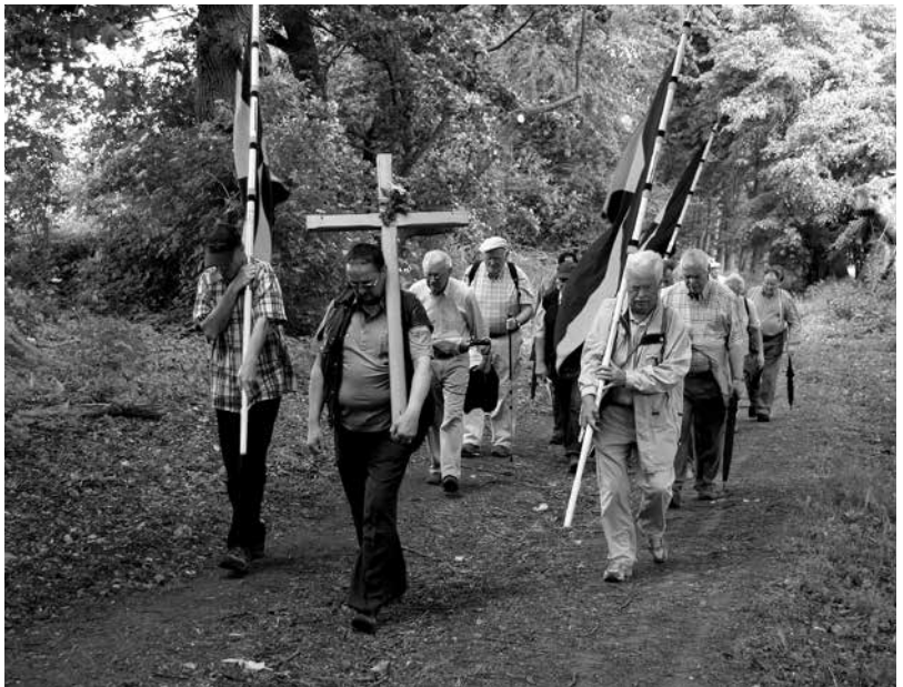
Unterwegs in der Baumallee in Richtung Marienkapelle. Wallfahrt 2011.