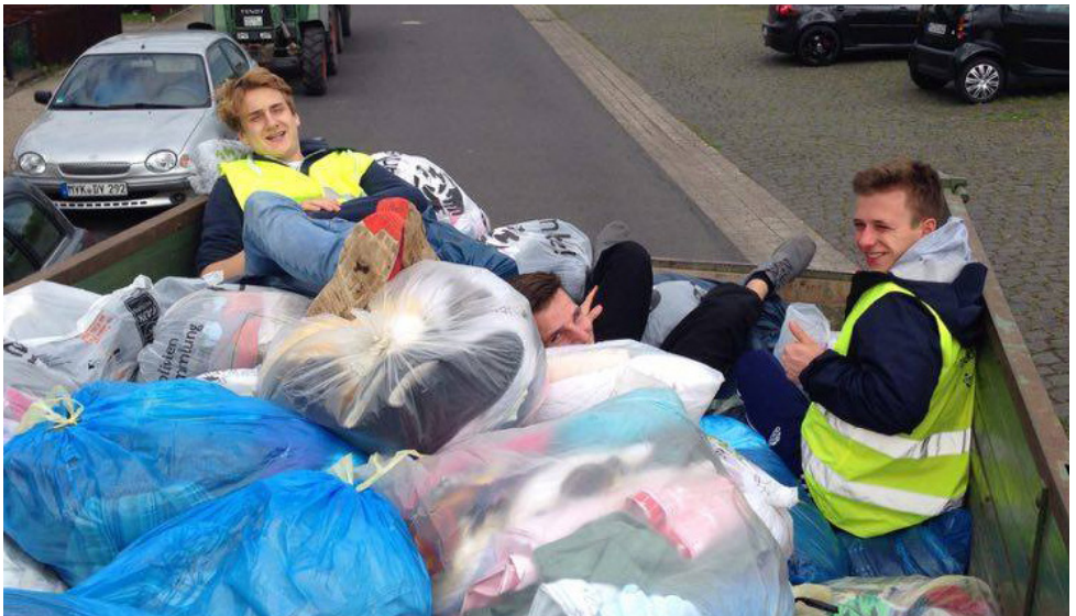
Am 13. Mai halfen wieder viele Kolpingmitglieder kräftig mit.