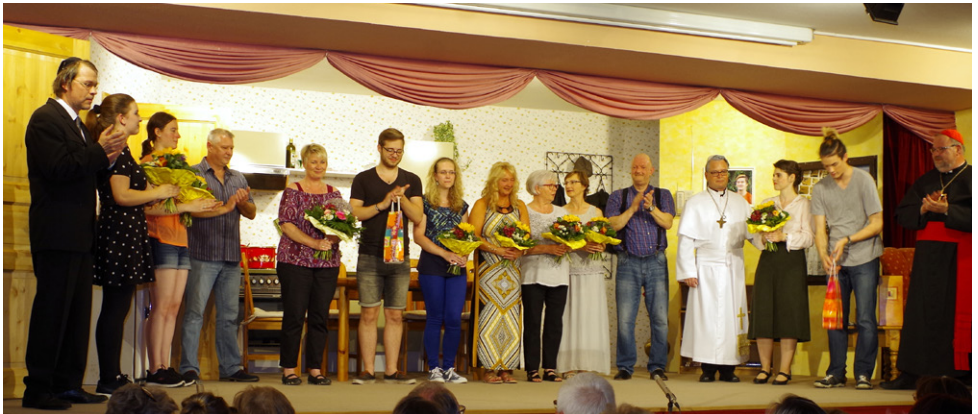
Mit viel Applaus verabschiedeten sich die Akteure von ihrem Publikum.